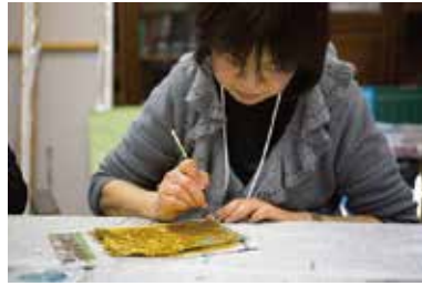
● ワニスを塗り、彩色を施します。