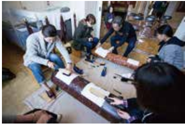
● 原紙を版木にあて、型を打ち出します。

旧呉鎮守府司令長官官舎洋館部の壁紙として 使用されている「金唐紙」の制作体験です。